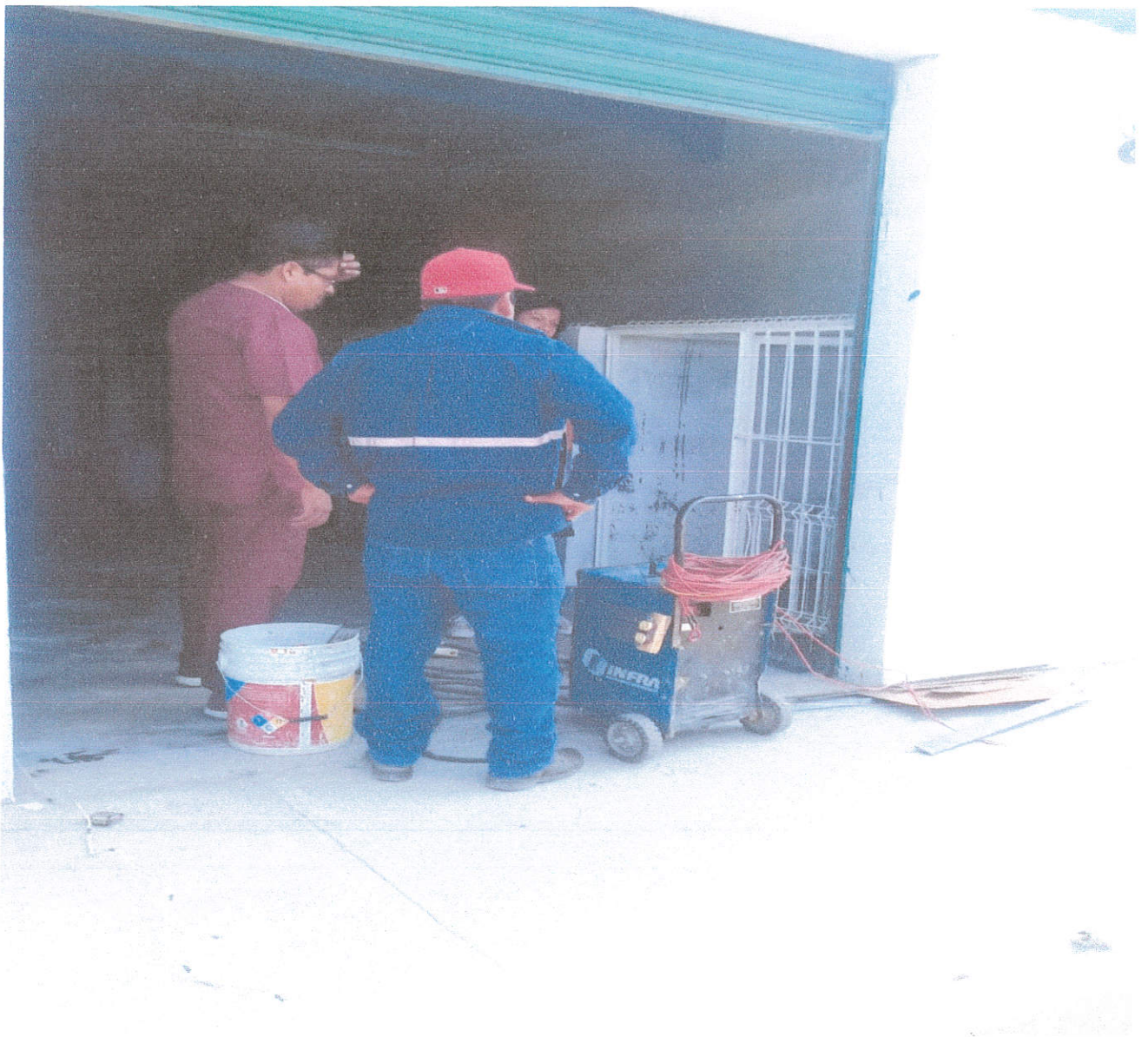
Reparación de Jaulas de Centro de Control Animal