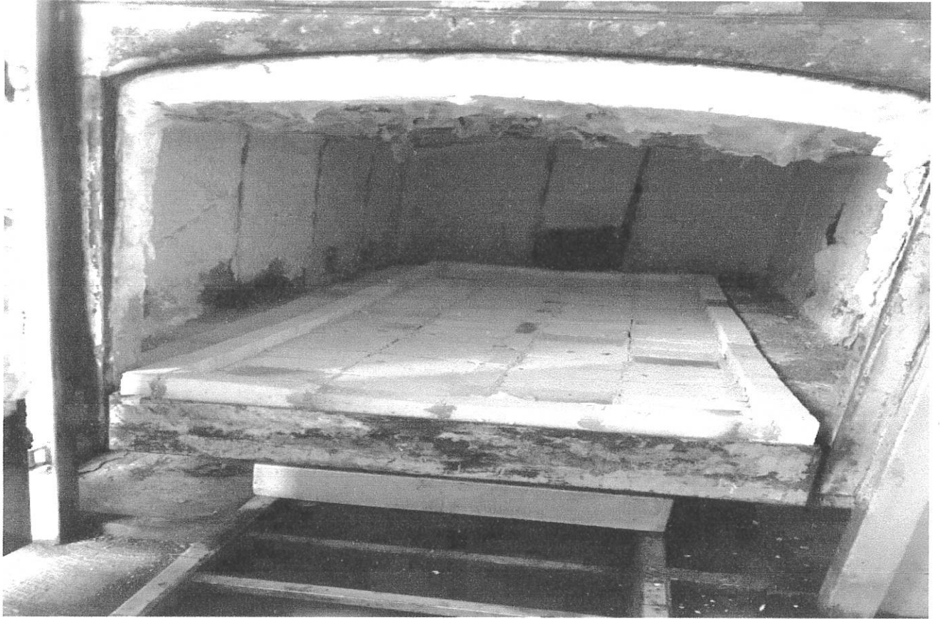
Mantenimiento del horno Incinerador de Centro de control Animal