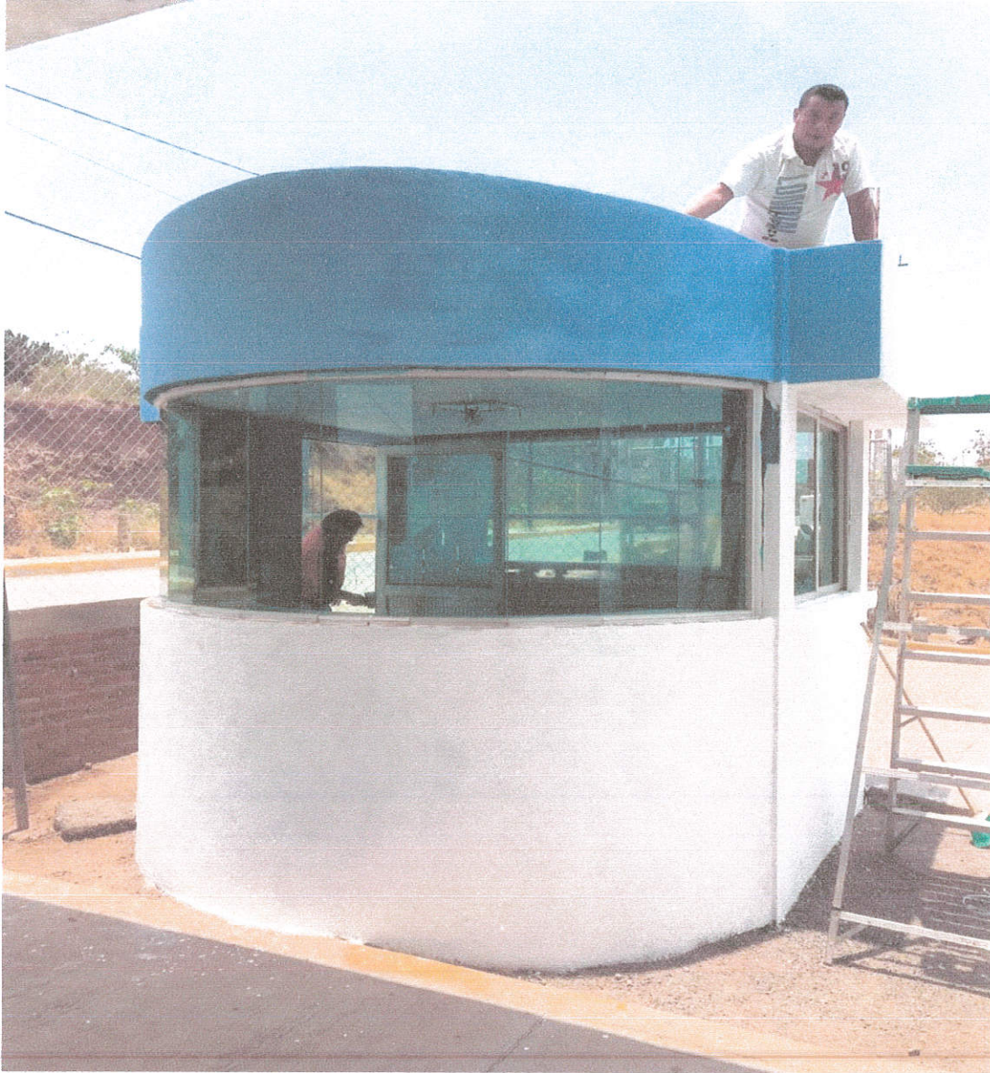
Se pintaron fachadas de las áreas de Centro de Control animal y la Dirección de Salud