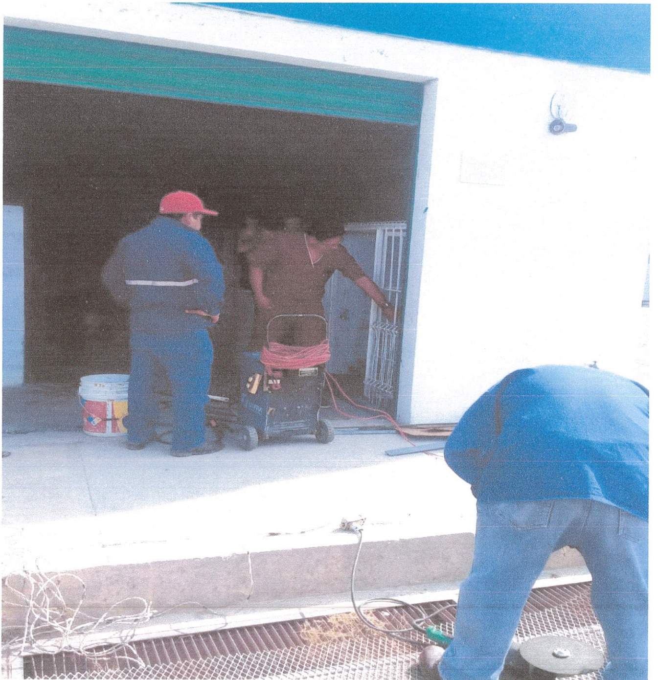
Reparación de Jaulas de Centro de Control Animal