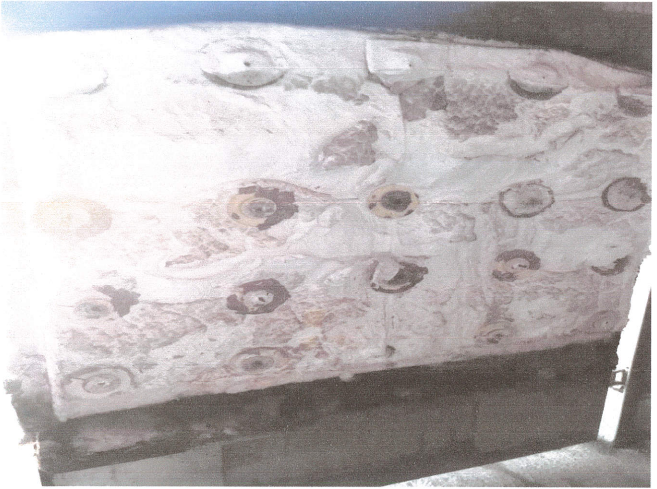
Mantenimiento del horno Incinerador de Centro de control Animal