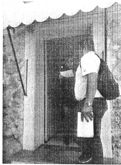
Volanteo de inspección para evitar el depositar residuos en la vía pública