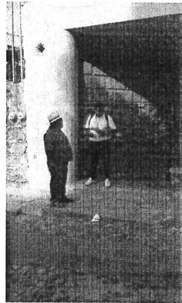
Entrevista con el reportante