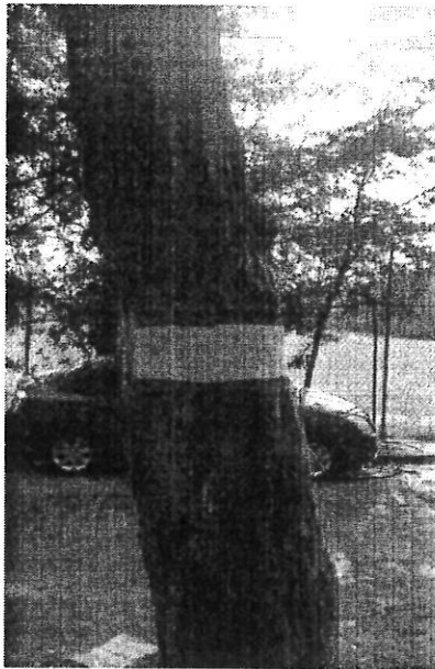
Avisos de prohibición