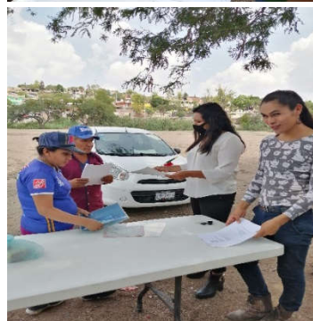
Fotografías de la reunión con los habitantes de Cañada de Bustos.