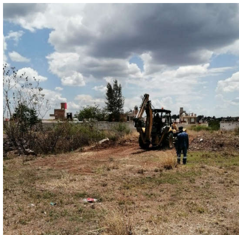
Fotografías de acciones para apertura de vialidad en Parcela 117 en conjunto con Obra Pública, Parcela que se integró al programa de escrituración efectuando acciones a la fecha, el objetivo es la escritura de un aproximado de 20 predios que aún no cuentan con certeza jurídica.