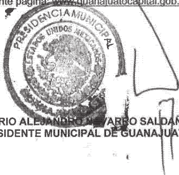
LIC. MARIO ALEJANDRO MARTÍNEZ SALDAÑA EL PRESIDENTE MUNICIPAL DE GUANAJUATO

SEGUNDO. Publíquense las presentes Reglas de Operación y sus anexos en el Periódico Oficial del Gobierno del Estado de Guanajuato. Los formatos referidos en las presentes reglas de operación estarán disponibles en la siguiente página: www.guanajuatocapital.gob.mx .