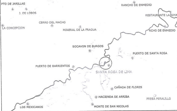
CROQUIS DE LOCALIZACION