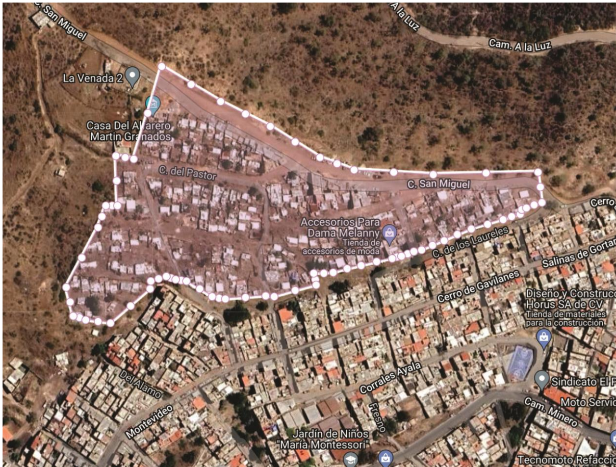
Imagen 1. Imagen ilustrativa de construcciones existentes dentro del polígono de La Venada II.

En el predio se fue dando la ocupación espontánea e irregular de familias dentro de los 36,903.497m 2 .